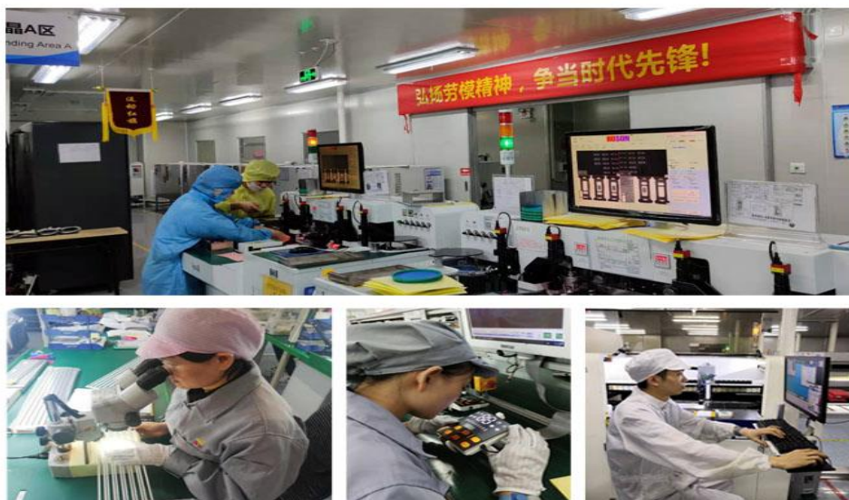
（“质量月改善项目”活动）

公司深入贯彻“全员参与，质量第一，持续改进，为顾客提供满意的产品和服务”的质量方针，高度重视产品质量，不断增强对生产过程的质量把控，完善质量内控标准，提升全员对质量管理重要性的认识和质量意识管控水平。每年开展“质量月”活动，2019年通过专项攻关、劳动竞赛、建言献策等专题活动，实现新品进仓率、生产效率、成品进仓批次合格率等质量指标的有效提高，不断推动供应链管理标准化的落地应用和持续完善，实现工艺优化、品质提升、管理升级，使效益与质量相互促进，形成良性循环，为持续提供满意的产品和服务提供有力的保障。